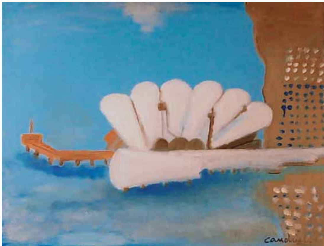
Lignano. Terrazza mare (veduta aerea)