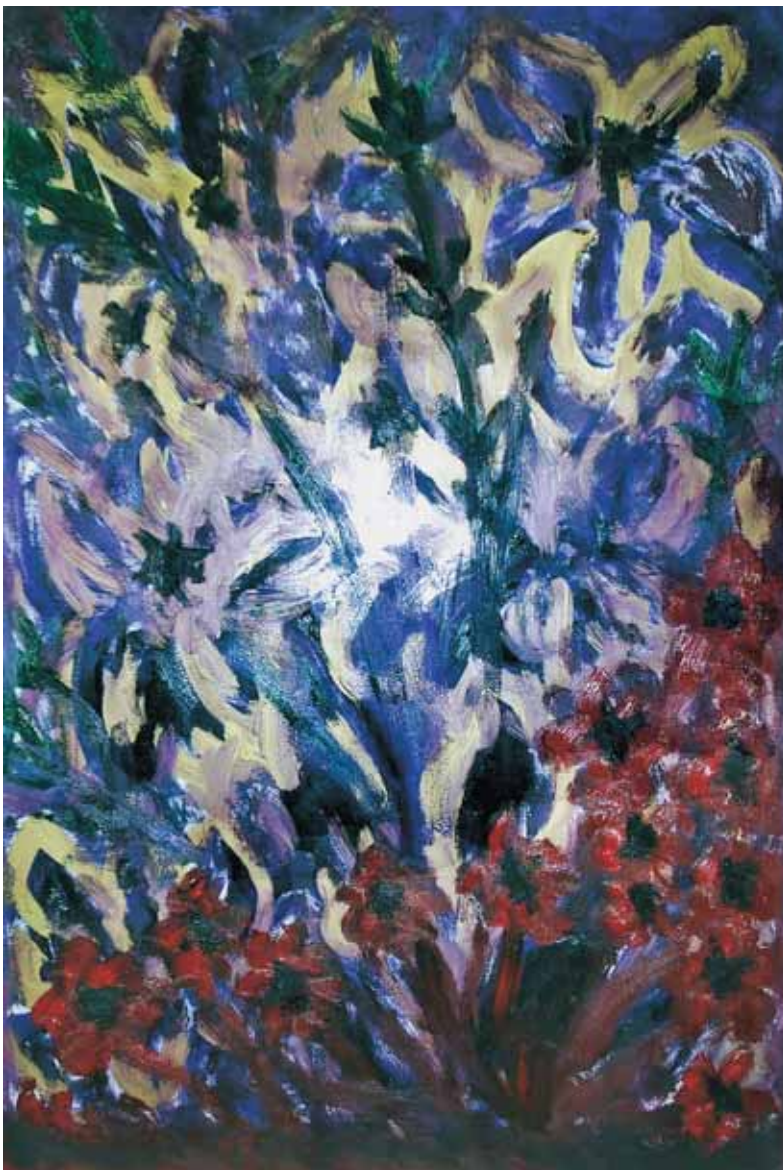
Composizione di fiori