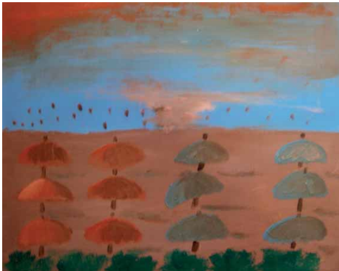
Lignano. La spiaggia