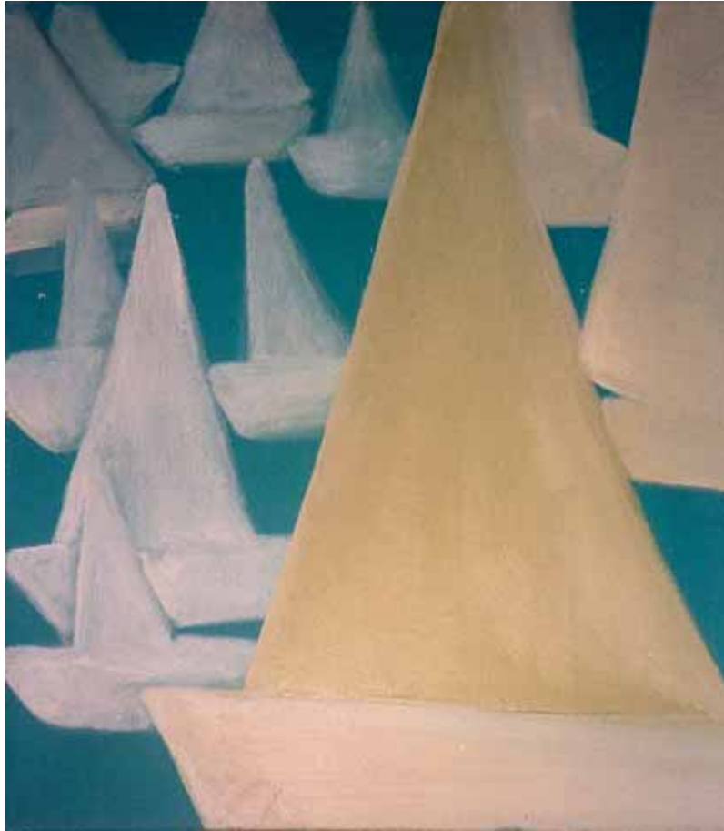
Barche a Lignano