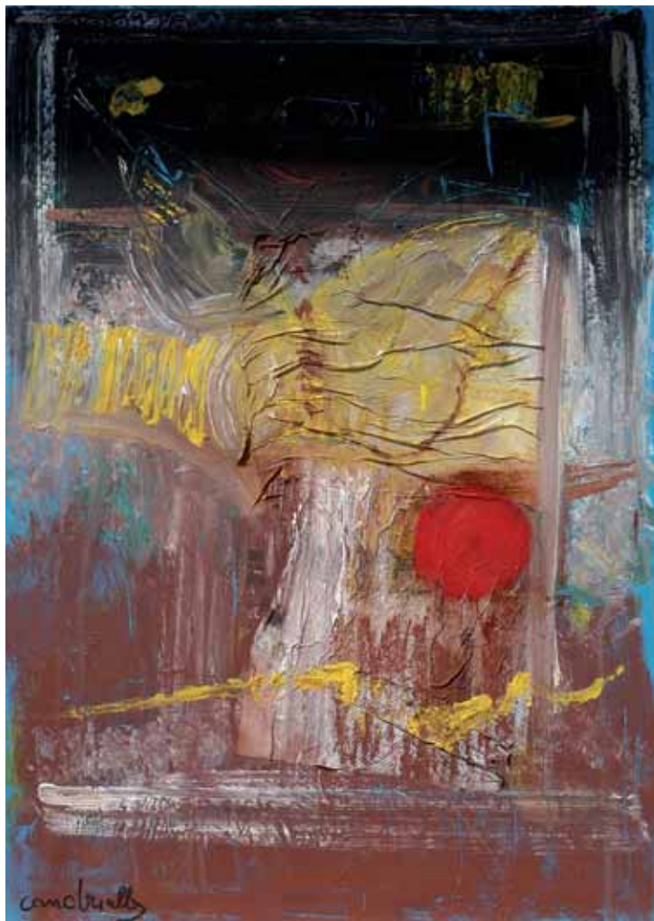
"Tensioni nel Mondo"