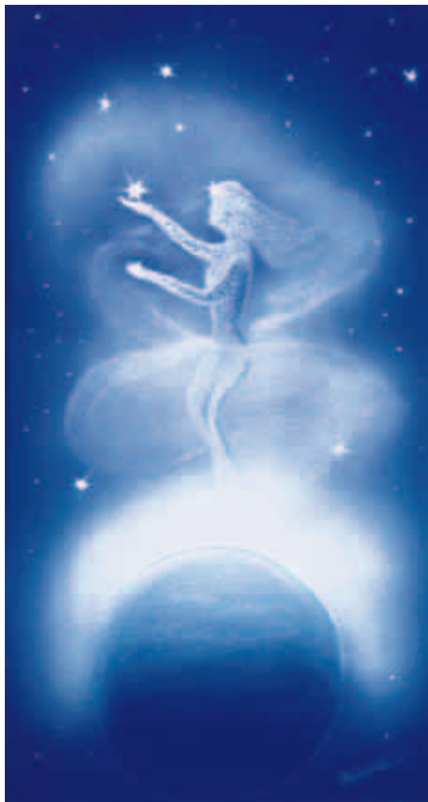
Raccoglitrice di stelle