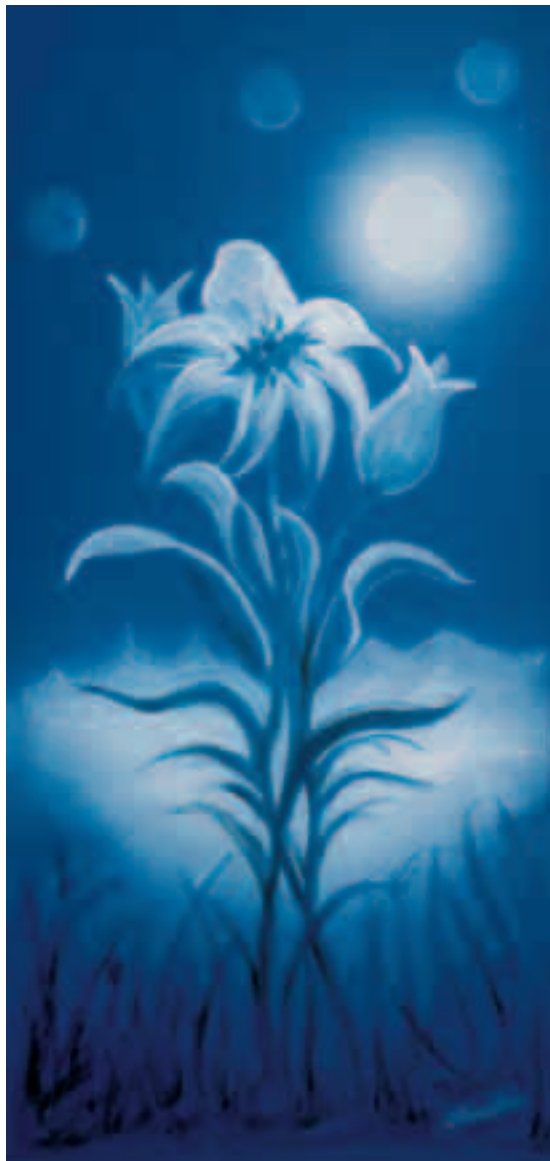
La luna ci guarda