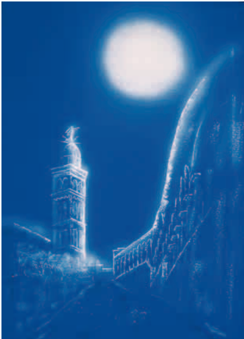
Luci in castello