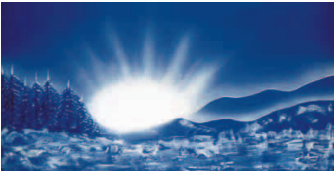
Alba tra le colline