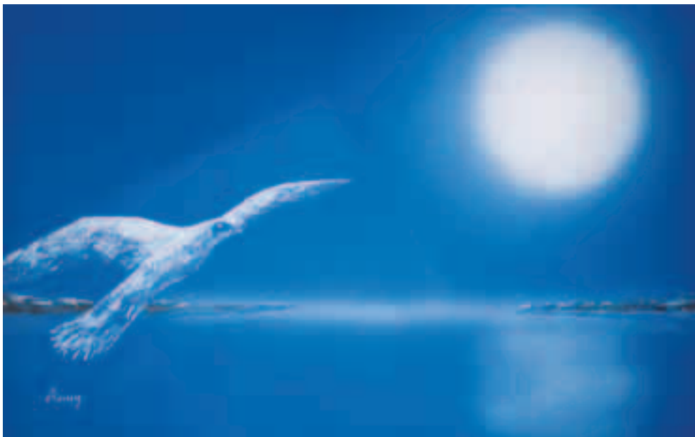
Libero di volare