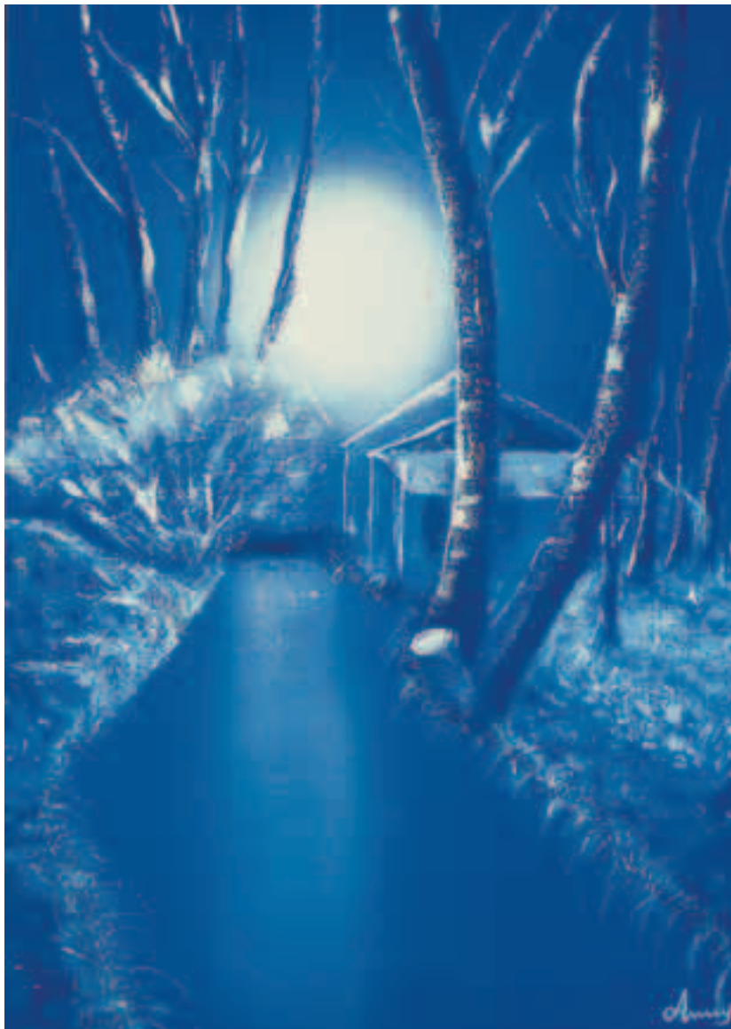
Luce sulla roggia