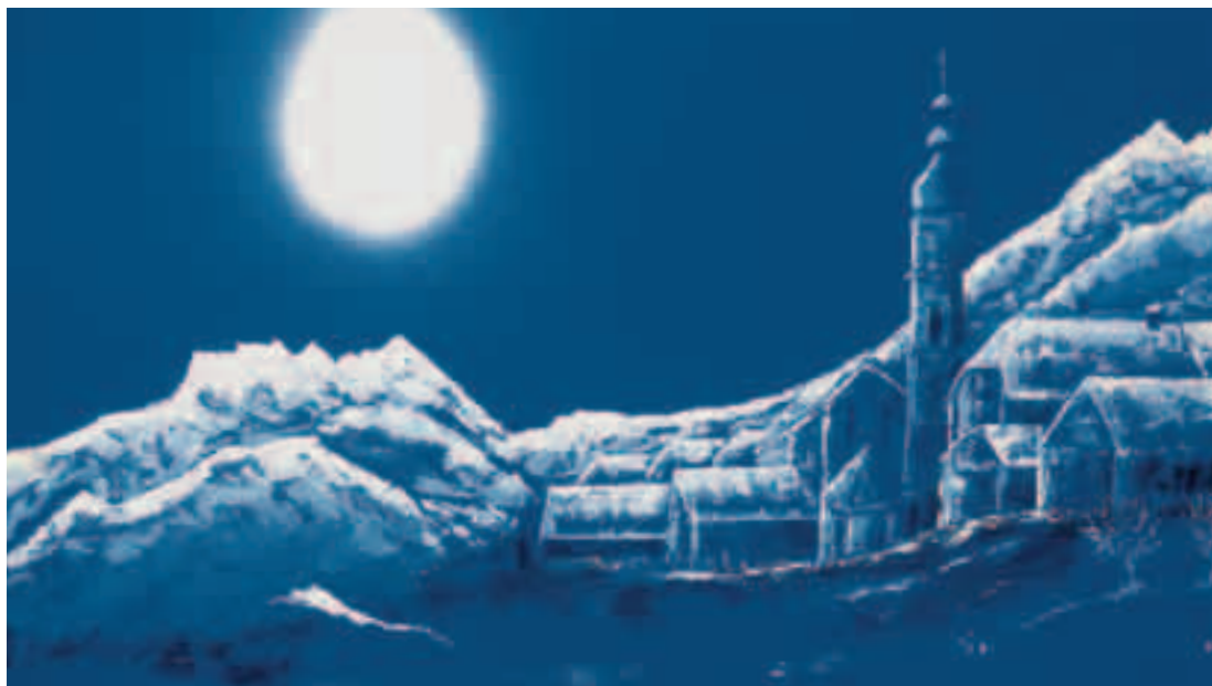
Luci di Carnia