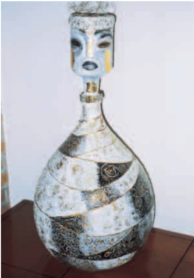
Sciamano Tecnica mista su damigiana e bottiglia in vetro riciclate, 2004