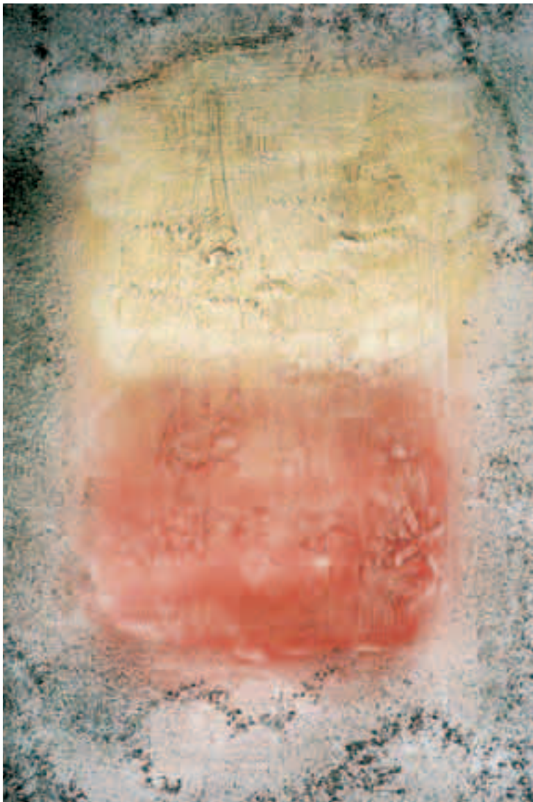
Finestra esistenziale Tecnica mista su pannello in legno - 50x110, 2002