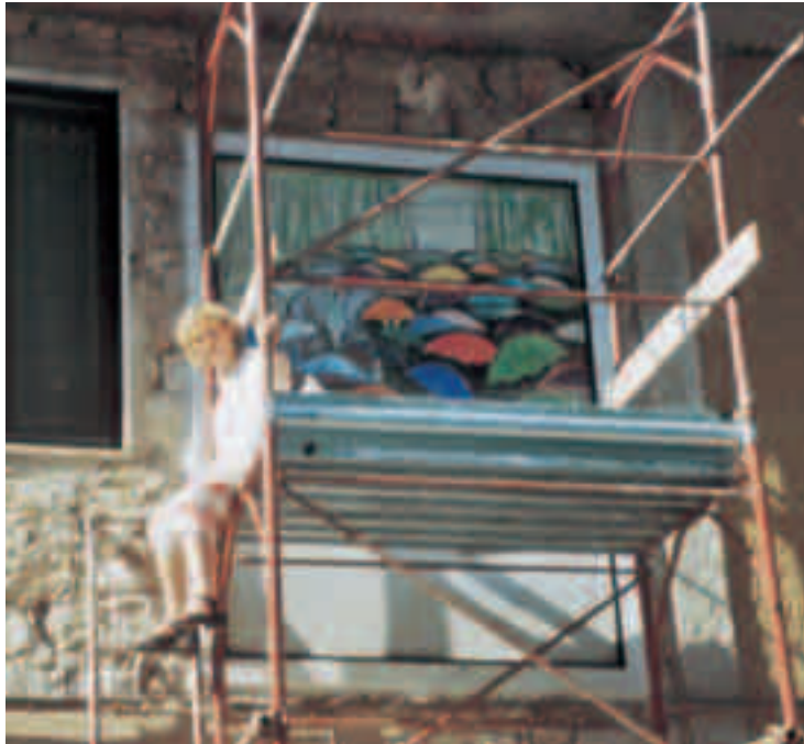
Murales a Ottati (SA)