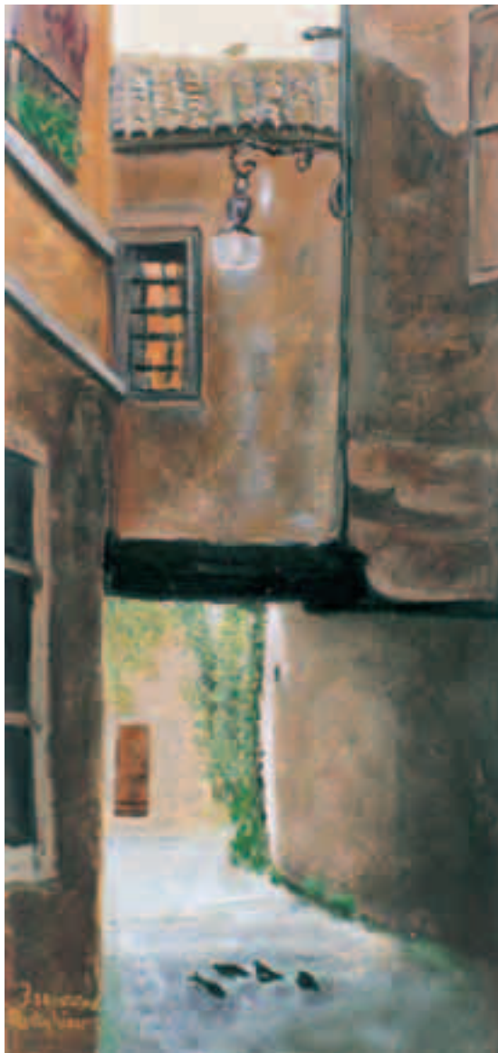
Vicolo Raddi - Udine