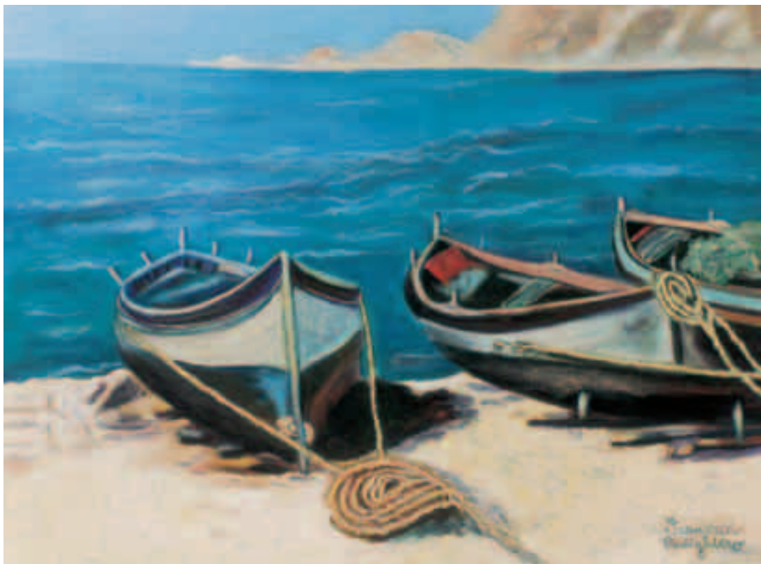
Barche in secca