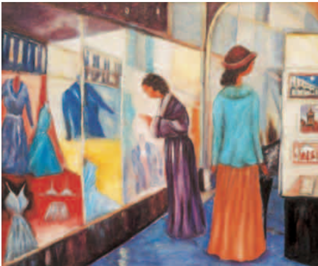
A passeggio per Gemona