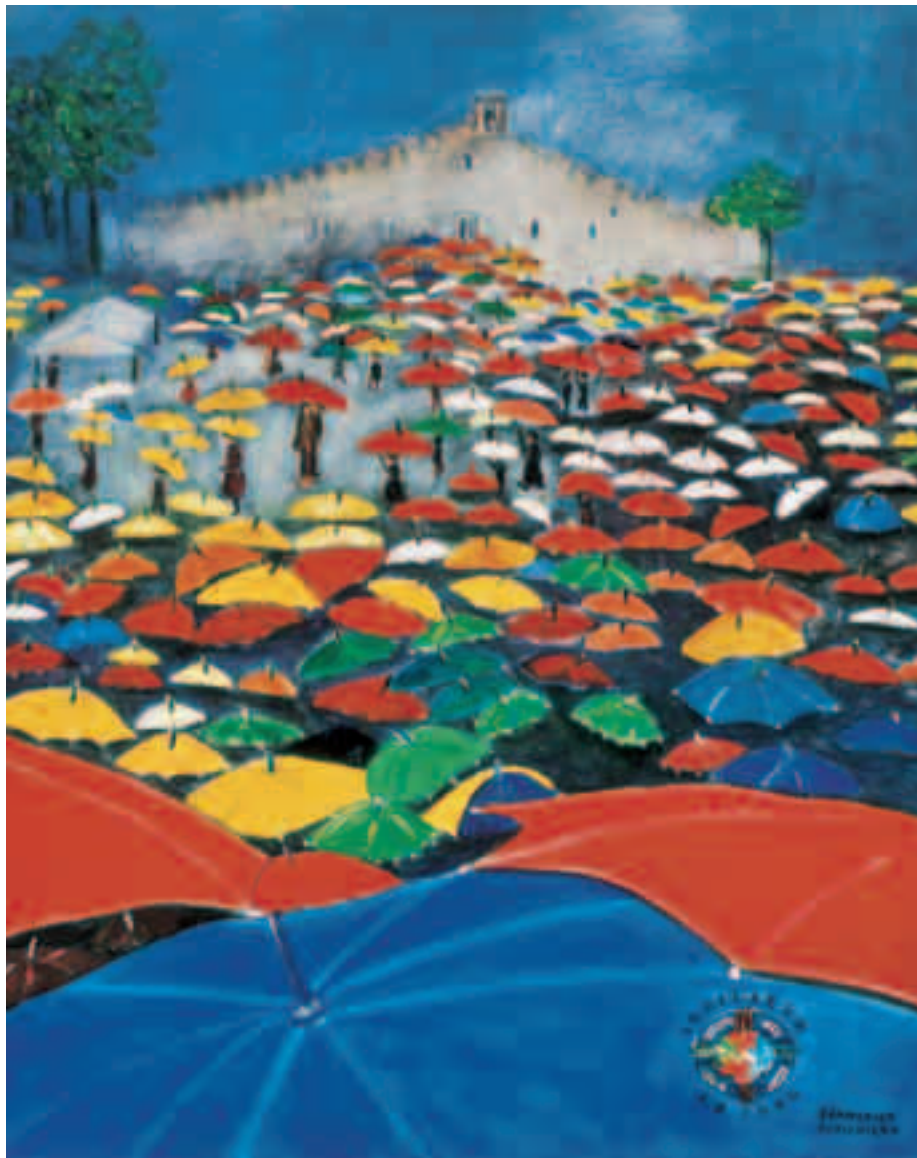
La danza degli ombrelli